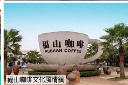
福山咖啡文化風情鎮