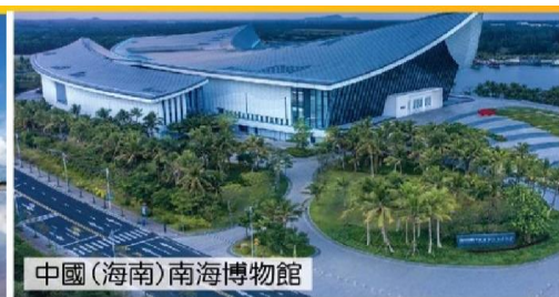
中國(海南)南海博物館